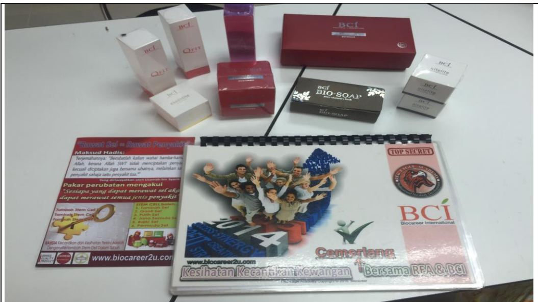
Caption : PRODUK DARI BCI – BIOCAREER INTERNATIONAL