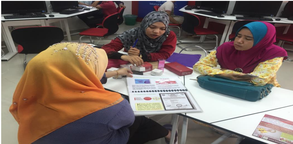
Caption : SESI TAKLIMAT PENERANGAN PRODUK BCI